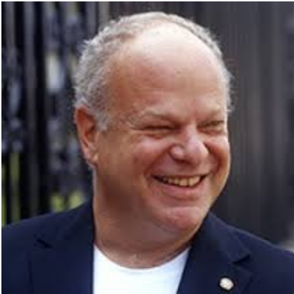
Martin E. P. Seligman

Osiągnięcie szczęścia to prawdziwe dążenie ludzkości. Spędzamy większość naszego życia w pogoni za szczęściem.