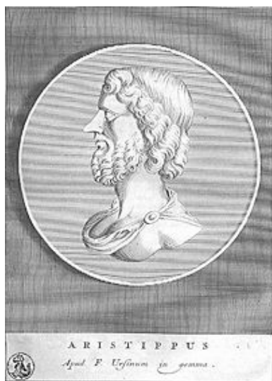
Arystyp z Cyreny

Tak więc podczas gdy Arystyp określił przyjemność jako wartość samą w sobie, którą można używać intensywnie, Epikur określił umiar przyjemności, w celu dotarcia do prawdziwego szczęścia.