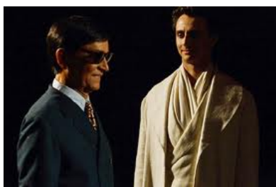
Chico Xavier i Emmanuel

Na koniec przytoczę krótką historię, która daje jednak naprawdę wiele do myślenia i jest świetną wskazówką dla spirytystów.